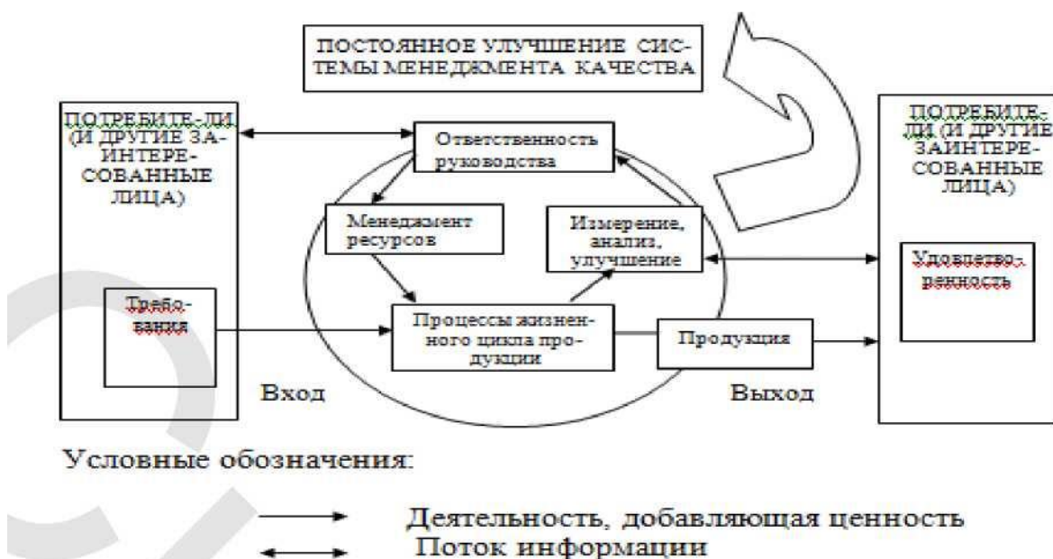
Рис. 1. Модель системы менеджмента качества, основанной на процессном подходе

На рис. 1 представлена модель системы менеджмента качества, основанная на процессном подходе.